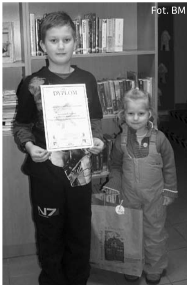
Praca Dawida Sznapki podobała się najbardziej