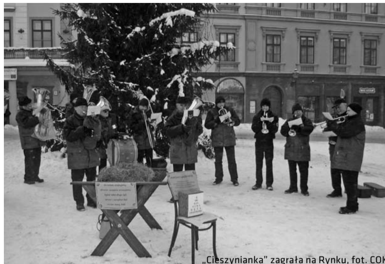
„Cieszynianka” zagrała na Rynku

Wszystkim mieszkańcom Cieszyna za udzielone wsparcie serdecznie dziękujemy. COK