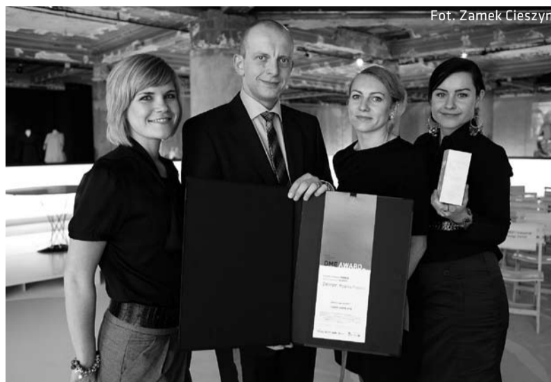
Delegacja firmy ZELMER S.A. odbierająca nagrodę, Lizbona 10.12.2010