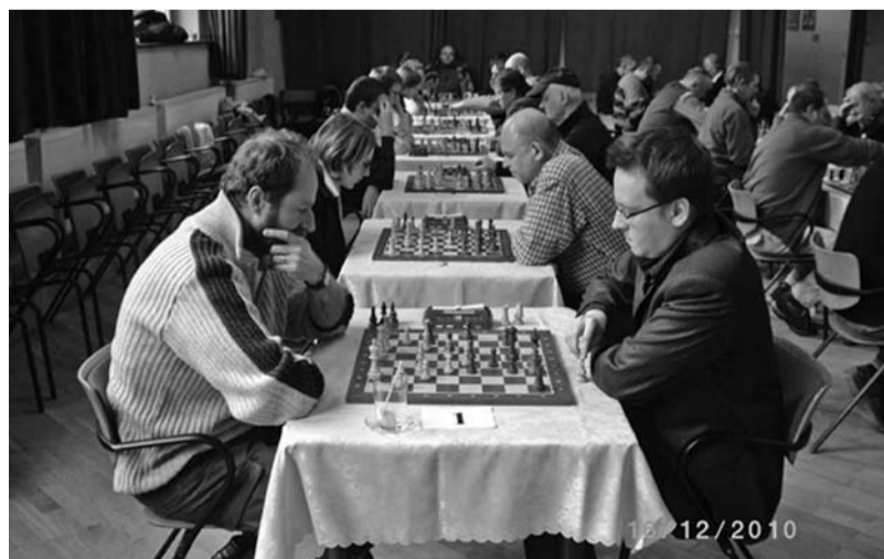
W Turnieju wzięło udział 61 zawodników