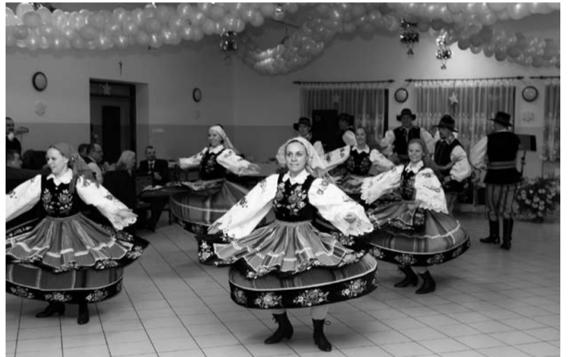
Na balu karnawałowym